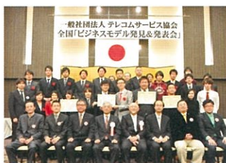
全国大会決勝 入賞者 / 審査委員