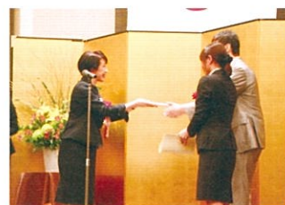
総務大臣賞 授与式