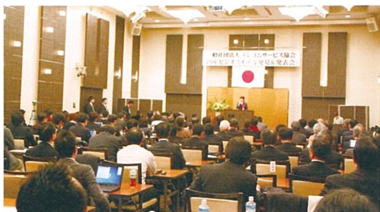
全国大会決勝会場（メルパルク東京）

北陸先端科学技術大学院大学、(株)立山システム研究所 (株)テレファーム、(株)リアリスタ、沖縄工業高等専門学校