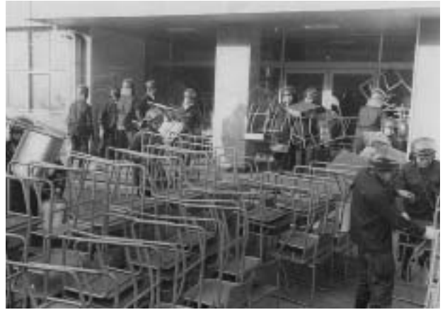
いすなどのバリケードを排除する機動隊（昭和44年4月9日）