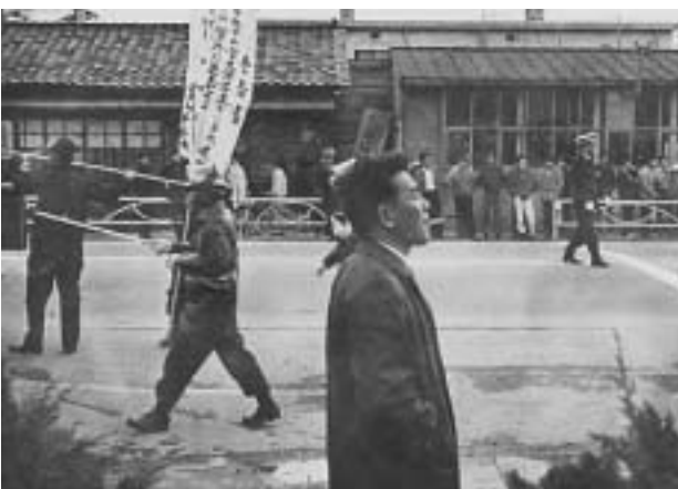
学園紛争（昭和43～44年ころ）機動隊出動