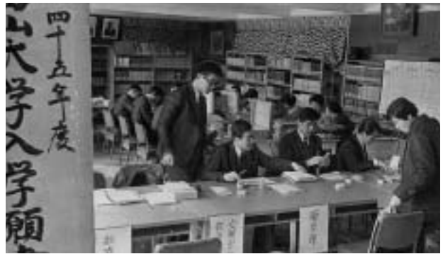
紛争の最中、学外に場所を移して始まった入学願書の受け付け 富山大附属中学校（昭和44年2月12日）