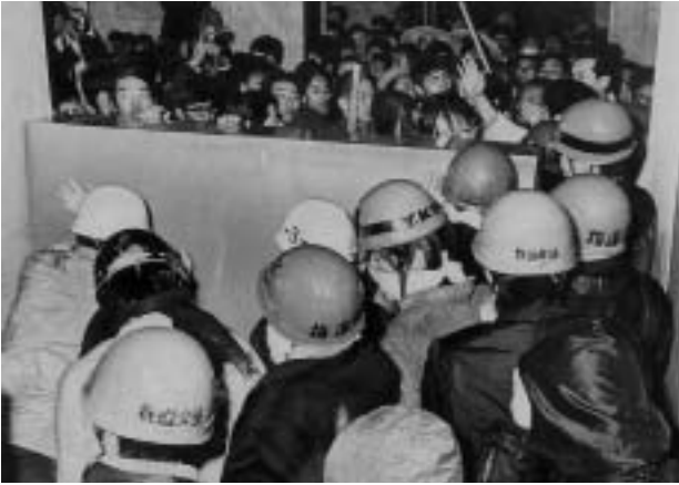
薬学部を封鎖する学生（手前）とぶつかり合う教職員ら （昭和44年3月11日）