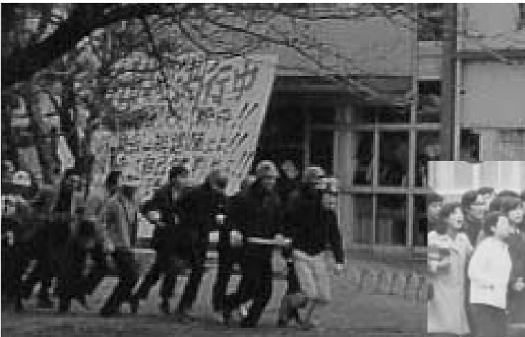
学園紛争（昭和43～44年ころ）学生デモ