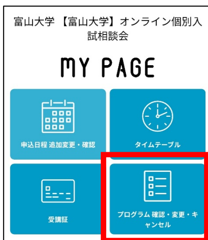
①マイページトップ画面