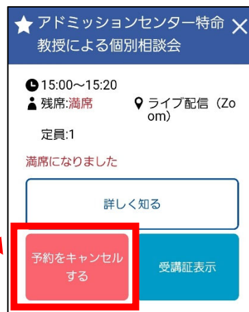
③予約中時間枠キャンセル画面