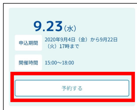
③日程の画面(新たに日程を予約)