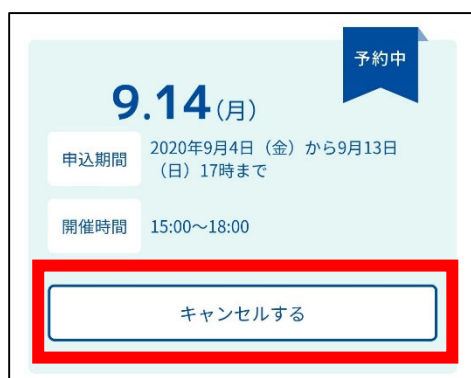
②日程の画面(予約中の日程をキャンセル)