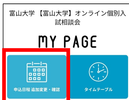
①マイページトップ画面