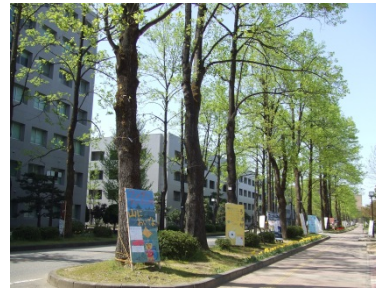
富山大学 (五福キャンパス)

富山大学のある富山市は県庁所在地であり、人口約42万人をかかえる近代的な都市である。北陸新幹線により、東京へは約2時間で移動が可能である。また、市内には富山空港（東京まで約1時間）がある。水と空気と海産物がおいしく、文化的施設の整っている便利なおとなとして、全国的に住みやすい街の最上位にあげられている。