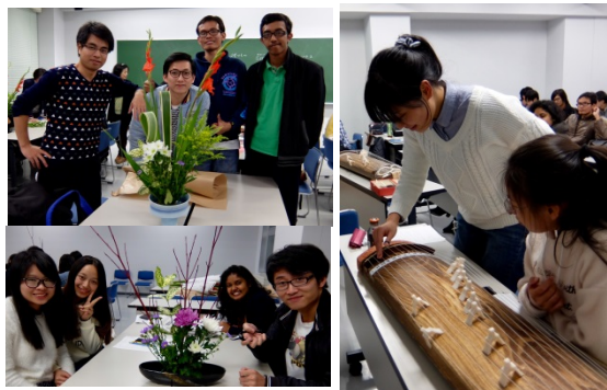
日本事情 「華道」「日本の民謡」