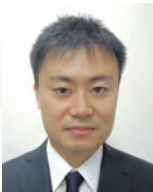
環境省 地球環境局 総務課研究調査室