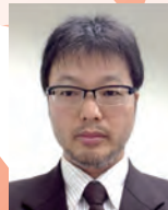
富山大学研究推進機構極東地域研究センター 教授

2006年東日本旅客鉄道(株)入社。品川駅駅社員・常磐線車掌・山手線運転士等の業務に従事した後、2010年より東京支社総務部人事課要員・採用グループにて採用や勤務制度を担当。2012年より本社鉄道事業本部営業部要員・契約グループにて契約社員の採用や駅の要員効率化施策を担当。2015年7月より総合企画本部経営企画部付で環境省に出向し、地球環境局総務課研究調査室にて「気候変動の影響への適応計画」の策定を担当。環境専門調査員。