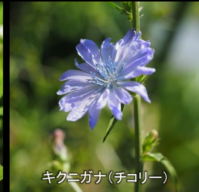
キクニガナ(チコリー)