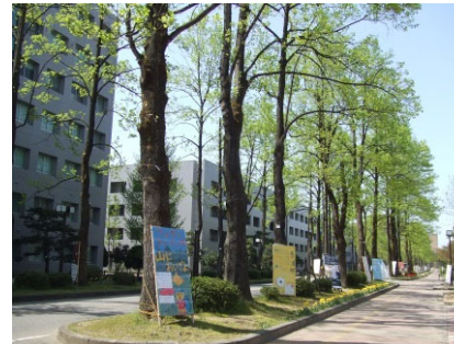
富山大学 (五福キャンパス)

富山大学のある富山市は県庁所在地であり、人口約41万人をかかえる近代的な都市である。北陸新幹線により、東京へは約2時間で移動が可能である。また、市内には富山空港（東京まで約1時間）がある。水と空気と海産物がおいしく、文化的施設の整っている便利なおとなし街として、全国的に住みやすい街の最上位にあげられている。