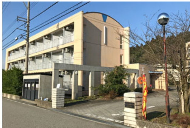
五福国際交流会館