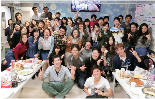
日本人学生主催 「ウェルカムパーティ」