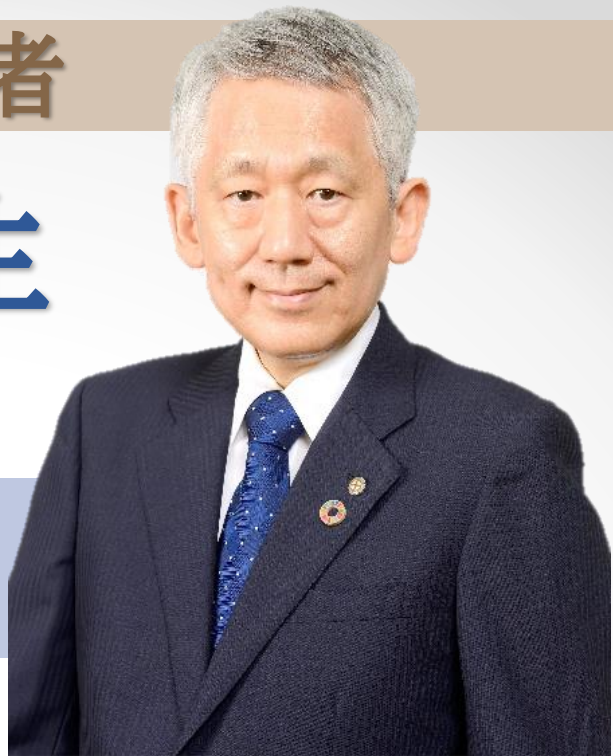
富山県出身 富山県名誉県民 (株)島津製作所 エグゼクティブ・リサーチフェロー 富山大学特任教授