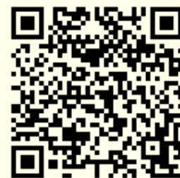
参加申込フォーム

上記の方法で申込ができない場合、 ①氏名 ②所属 ③ご希望の参加方法をメール本文にご記入の上、以下のメールアドレスに送信してください。