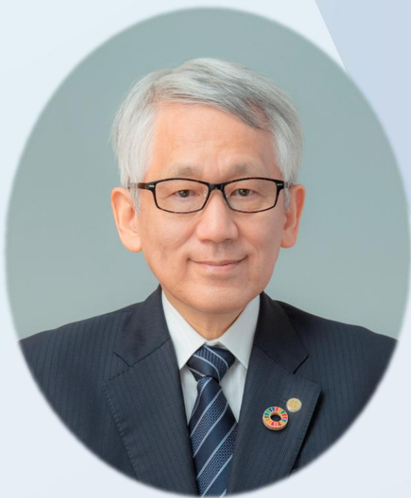
富山県出身 富山県名誉県民 (株)島津製作所 エグゼクティブ・リサーチフェロー 富山大学特任教授

質量分析や計測の基礎を知ること 様々な科学技術分野への理解・応用が広められることを紹介