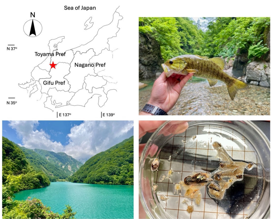
図1：桂湖の位置（左上）、背景（左下）、コクチバス（右上）とコクチバスの食べていたトンボ目成虫（右下）。