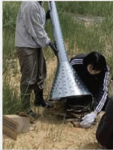
もみがらの山をつくる