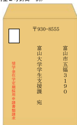
大学へ送付するための封筒 (角型2号封筒・例)