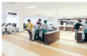
杉谷キャンパス食堂