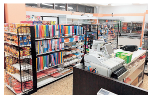
高岡キャンパス購買