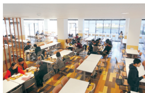
五福キャンパス食堂