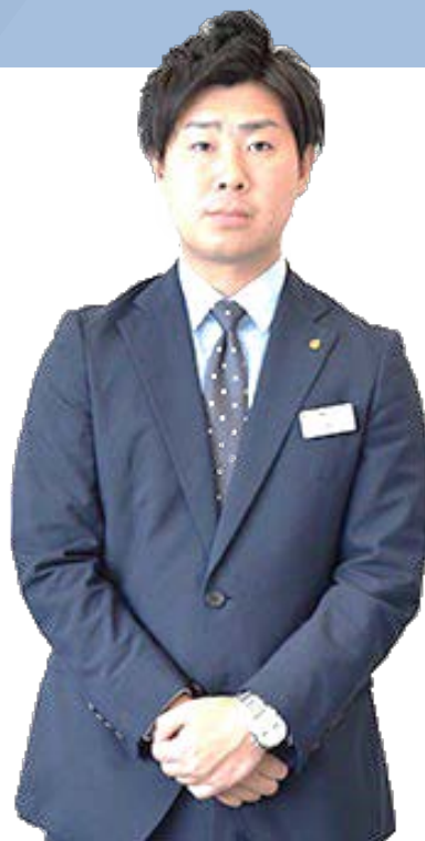
株式会社ジェック経営コンサルタント 第2事業部 課長

企業経営にプラス影響を与える、人的資源の活かし方について人事評価制度を中心とした手法を紹介しながらお話いたします。