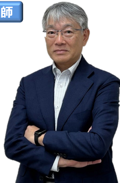
国立大学法人富山大学 研究推進機構 学術研究・産学連携本部 准教授