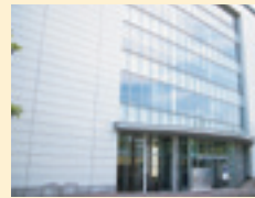
⑪ 医薬イノベーションセンター