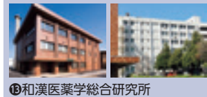
⑬ 和漢医薬学総合研究所