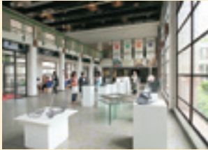
14 TSUMAMA-HALL (エントランスホール)

ゆったりとした吹き抜けの空間で窓からは中庭の眺めが広がります。学生たちが制作した作品を展示・発表するスペースとしても活用します。