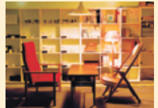
5 コミュニケーションセンター

芸術関係図書を中心に約7万冊の資料が収集・整理されています。館内の書架や閲覧テーブル、椅子はデザイン性や人間工学の面から配慮され、ゆったりと落ち着いた環境で利用することができます。