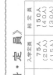
推薦入学学生(木工)