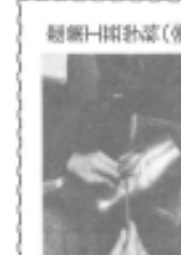
推薦入学学生(看護)

◎推薦入学の仕組み 推薦入学とは、社会人が、その専門分野での業績や経験に基づいて、大学の入学を推薦される制度です。